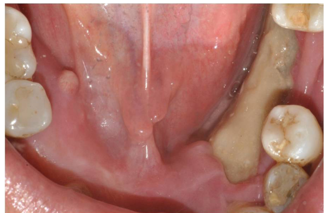
Figura 3. Vista oclusal, exposición del hueso, ubicación crestal en el maxilar inferior.

Foto tomada en nuestra práctica clínica.